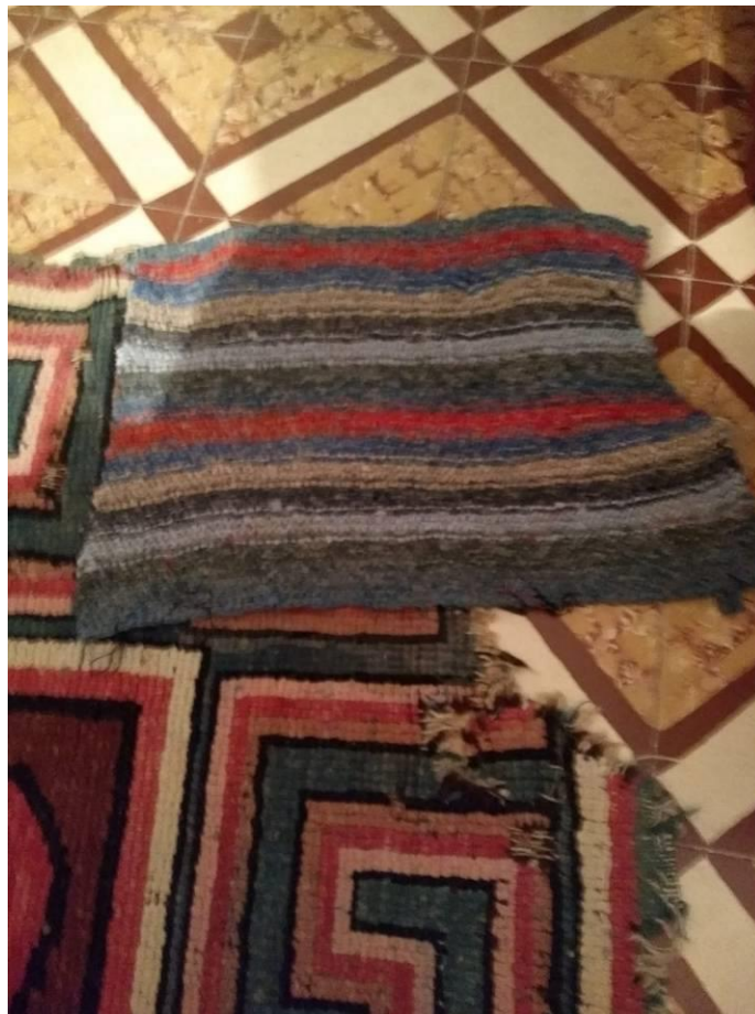
Detalle de los parches de punto o crochet colocados en las cuatro esquinas de la alfombra.