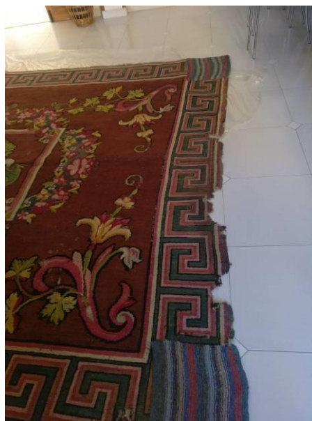
Detalle de los faltantes de tejido en los laterales