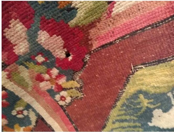
Detalle de una zona con erosión en los nudos